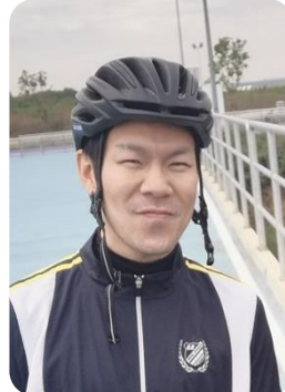
วิทยากรพิเศษ