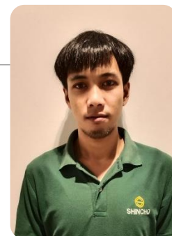
วิทยากรพิเศษ