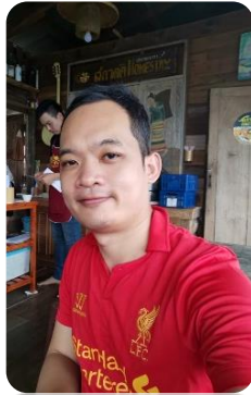
วิทยากรพิเศษ