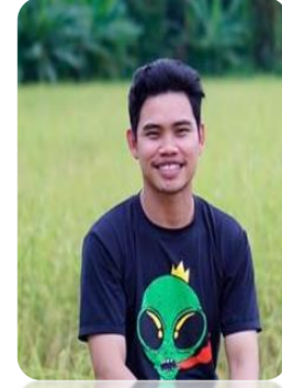
วิทยากรพิเศษ