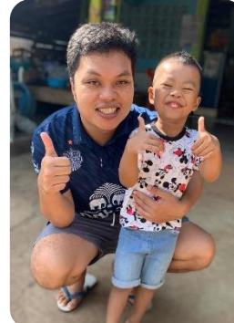
วิทยากรพิเศษ