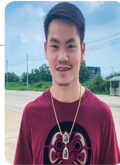
วิทยากรพิเศษ