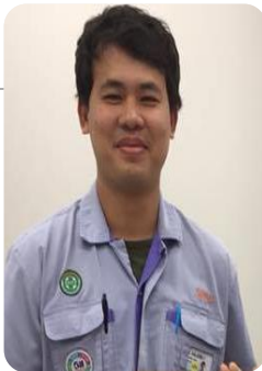
วิทยากรพิเศษ