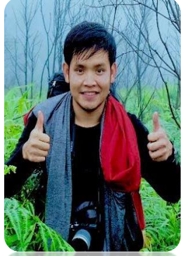
วิทยากรพิเศษ