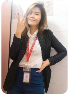
วิทยากรพิเศษ

(ชีวิตการทำงานเพื่อให้เกิดแรงบันดาลใจ และตระหนักถึงบทบาทหน้าที่ของตนเองที่จะก้าวสู่การเป็นวิศวกรที่ดีในอนาคต)