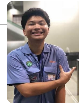
วิทยากรพิเศษ