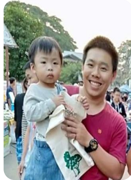
วิทยากรพิเศษ