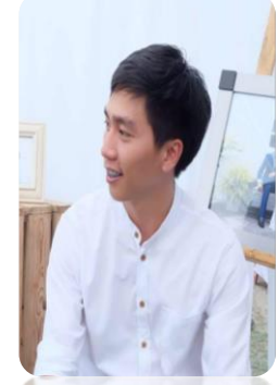
วิทยากรพิเศษ