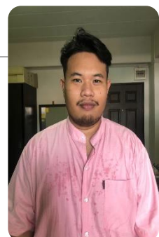
วิทยากรพิเศษ