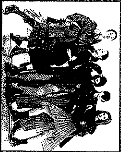
WILLIAMS UTAMA INDONESIA