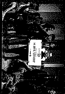
FINAL ROUND & AWARD ANNOUNCEMENT @SINGAPORE FASHION WEEK 2016