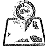
ภาคอีสาน