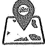
ภาคเหนือ