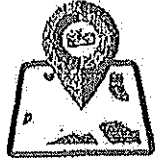
กรุงเทพฯและปริมณฑล