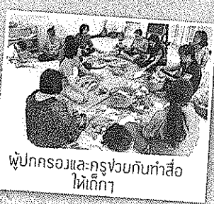
ผู้ปกครองและครูช่วยกันทำสื่อให้เด็ก

“ หากไม่มีศูนย์การศึกษาพิเศษ เราคงจะดูแลลูกสาวไปวัน ๆ ”