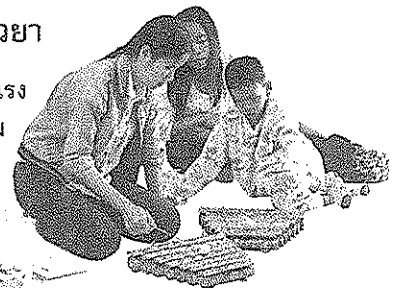
การโถกทริบ่าปัก

“การนำเอาแนวคิดการศึกษาเพื่อการเยียวยา มาใช้ในการพัฒนาคุณภาพชีวิตเด็กที่มีความพิการรุนแรง สิ่งที่เห็นเป็นรูปธรรม คือ ผู้ปกครองและครู มีส่วนร่วมในการทำงานกับเด็กอย่างเท่าเทียม เป็นการสร้างความเข้มแข็งและกำลังใจให้กับผู้ปกครองที่จะไปทำงานกับลูก จัดห้องเรียนได้สวยงาม กิจกรรมการเรียนการสอนมีหลากหลาย มีทั้งการเคลื่อนไหวและจังหวะ บทเพลง บทกลอน ศิลปะ ทั้งการวาดภาพ ระบายสี การปั้น การเล่านิทาน ดนตรี จิตตลีลา การนวด และงานฝีมือเย็บปักถักร้อย เป็นการฝึกการใช้มือ เพื่อเตรียมการเข้าสู่การทำอาชีพต่อไป ส่งผลให้เด็กและผู้ปกครองมีความสุข มีพัฒนาการด้านร่างกาย จิตใจ-อารมณ์ สังคม สติปัญญา และ จิตวิญญาณ การศึกษาเพื่อการเยียวยา ให้