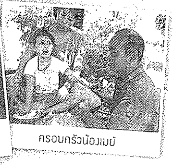
ครอบครัวน้องเมย์

จุลสารประชาสัมพันธ์ ศูนย์การศึกษาพิเศษ ประจำจังหวัดลำพูน ประจำเดือน พฤศจิกายน 2557