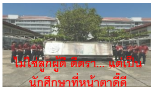
ไม่ใช่ลูกผู้ดี ตีตรา... แต่เป็น นักศึกษาที่หน้าตาดีดี