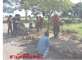
สามัคคีคือพลัง