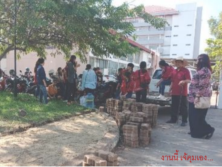
งานนี้ ใจตัวเอง...