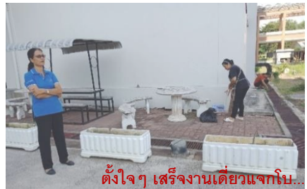
ตั้งใจๆ เสร็จงานเดี่ยวแจกโบ...

และขอขอบคุณทุกคนที่มีส่วนร่วมในการพัฒนาคณะฯ