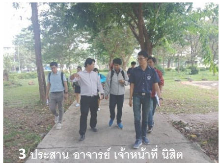
3 ประสาน อาจารย์ เจ้าหน้าที่ นิสิต