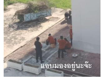
แอบมองอยู่นะจ๊ะ