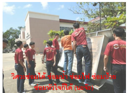
วิเศษขอไม่ได้ ขอแม่ ขอแม่ ขอแม่ ขอแม่ขอแม่ได้ (นะจ๊ะ)